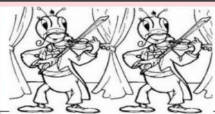
Les Cigalous du Minervois

Vous aimez le chant et la musique ? La chorale « les Cigalous du Minervois » vous accueillera avec beaucoup de chaleur et sympathie. Notre objectif est d'animer des manifestations, notamment au profit du Téléthon, des Restos du Cœur, de Rétina.